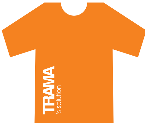
Basso a sinistra